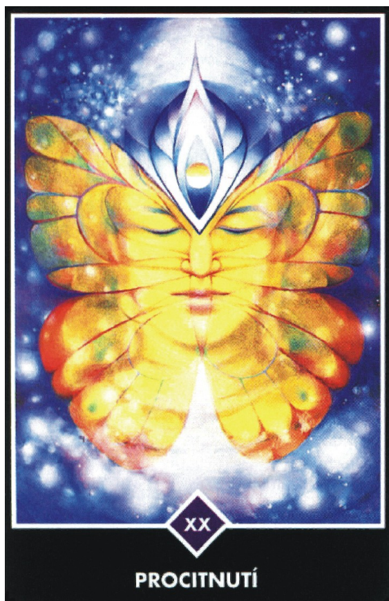
Obrázek 4: Osho zen tarot, Velká arkána XX Procitnutí