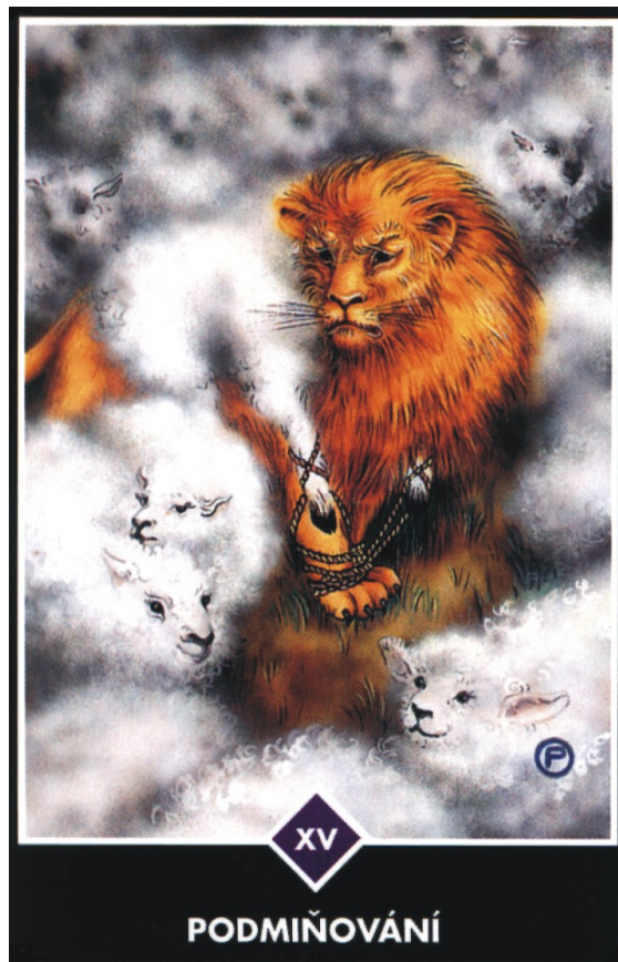
Obrázek 3: Osho zen tarot, Velká arkána XV Podmiňování