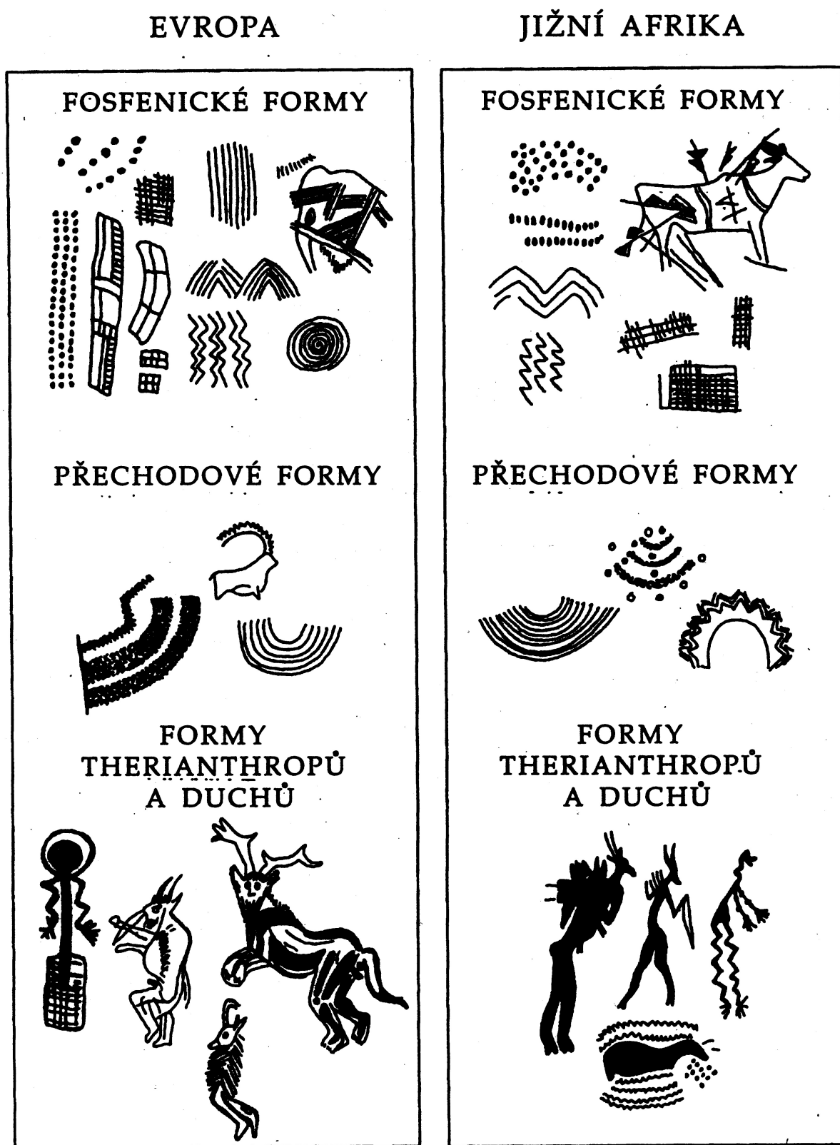
Obrázek 5: Fosfenické formy zobrazované ve "skalním umění" Evropy a Afriky