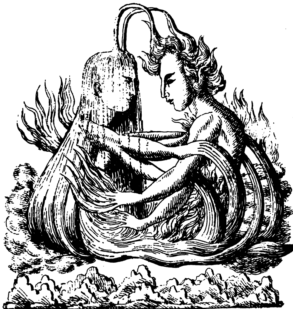
Obrázek 2: Indická představa sjednocení dvou živlů - vody a ohně.